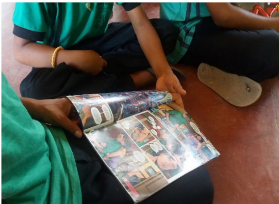
Figura 1: Leitura em duplas na sala de aula das Histórias em Quadrinhos-HQs.

A figura1, abaixo representa esse momento de leitura e compartilhamento coletivo do que foi lido e aprendido na HQs que estava em suas mãos.