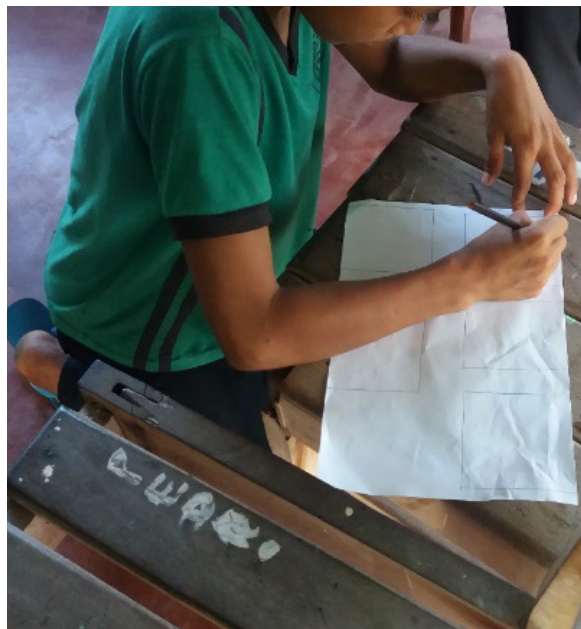
Figura 2: Criança desenhando a sua História em Quadrinhos – HQs.

Em outro momento, pedimos que as histórias em quadrinhos lidas fossem representadas por elas por meio de construções de HQs.