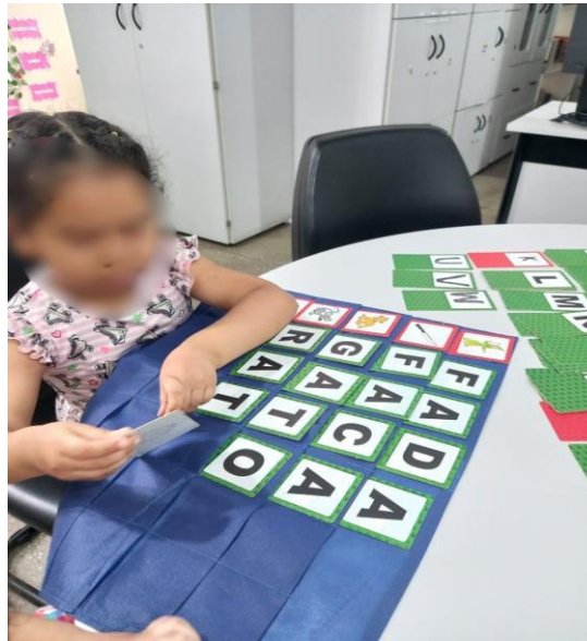
Figura 1- Atividades desenvolvidas no Espaço Lúdico.

tiveram acesso às experiências de aprendizagem que favorecem seu desenvolvimento intelectual, emocional e social. Essa afirmação revela um efeito que vai além do cuidado físico: a escola se torna, simultaneamente, um espaço de aprendizagem para mães e filhos, o que fortalece a relação afetiva com o ambiente escolar (Freire, 2006). Na figura 1, é possível observar uma das atividades desenvolvidas no Espaço Lúdico relacionadas a conteúdos formais que contribuíram para o desenvolvimento e aprendizagem das crianças envolvidas.