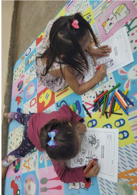
Figura 2 - Atividade de Pintura no Espaço Lúdico

querer vir mais ainda”. Esse interesse da criança retroalimenta o compromisso da mãe com a frequência escolar, criando uma relação de reciprocidade no engajamento, um fenômeno que dialoga com a noção freireana de educação como prática de liberdade, onde o ato de aprender envolve toda a comunidade familiar (Freire, 2006). Na figura 2, é possível observar uma atividade envolvendo pintura que foi realizada durante a execução do projeto.