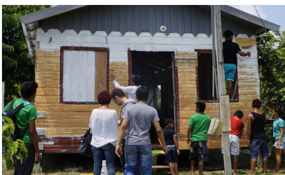
Figura 5: Pintura da Biblioteca com a Tinta Ecológica