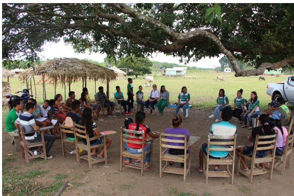
Figura 1: Reunião de diagnóstico na Aldeia Moyray

Na fase do diagnóstico foi realizada uma reunião em forma de roda de conversa (figura 1), com em torno de 40 comunitários. Nesse momento, pode-se observar o anseio dos comunitários para ter uma biblioteca. Ficou evidente nas falas dos mesmos a preocupação com as crianças e jovens da comunidade, pois, segundo eles, a falta de opção de entretenimento, tem feito que as crianças fiquem muito tempo assistindo televisão e os jovens se sentem desestimulados a darem continuidade aos estudos.