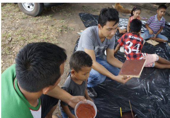
Figura 4: Oficina Tons da terra

aos comunitários a fabricação de tinta utilizando pigmentos do solo da própria comunidade. O desenvolvimento da oficina trata-se da transferência de uma tecnologia social, pois os comunitários podem produzir a tinta utilizando materiais de baixo custo e extraídos da própria comunidade. Durante a execução do projeto, a tinta produzida foi utilizada para a pintura da própria Biblioteca (figura 5). A aprendizagem da técnica foi de grande relevância para os comunitários, pois a mesma poderá ser aplicada para pintura de outros ambientes da comunidade.