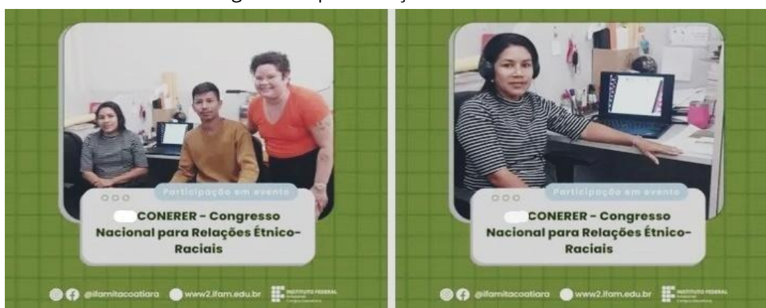
Figura 5 - Apresentação no IV CONERER.