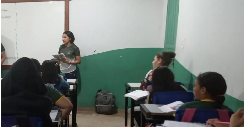
Figura 1 - Entrega do material e debate.