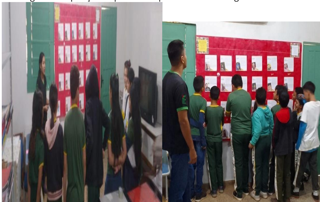
Figura 3 - Exposição de painel com personalidades indígenas brasileiras.

Esse foi o momento em que os alunos conheceram grandes nomes da literatura indígena, autores, artistas da música, televisão, da política, influenciadores digitais, representantes e lideranças indígenas brasileiras. Vale destacar que esse foi o auge do projeto, visto que, os alunos puderam ver a biografia das personalidades indígenas, fazer perguntas e realizaram muitas colocações, principalmente pelas vestes, pintura no rosto, artefatos que as lideranças indígenas usavam, falaram quais personalidades nunca tinham visto ou ouvido falar e para os discentes de ascendência indígena, foi a oportunidade em que muitos se viram em determinadas profissões futuras, diante do que lhes era apresentado.