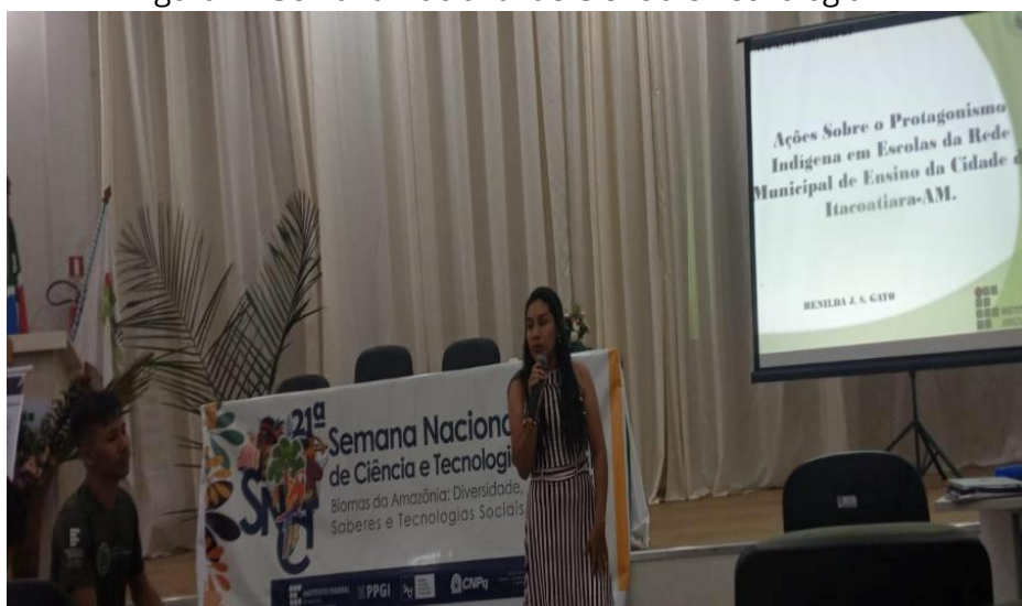
Figura 4 - Semana Nacional de Ciência e Tecnologia