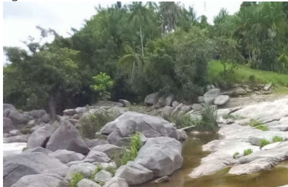
Figura 1: Ilha de Duraka