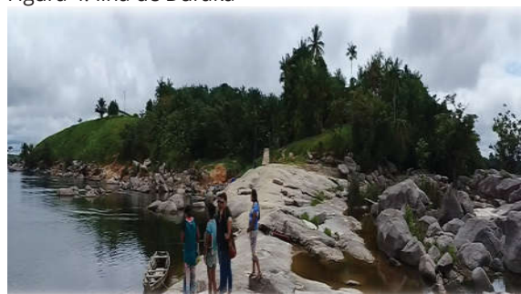
Figura 4: Ilha de Duraka

A comunidade se auto sustenta através da agricultura comunitária, do artesanato e das visitas de turistas que visam conhecer também as danças e rituais que estão sendo resgatados, valorizados e compartilhados com os mais jovens.