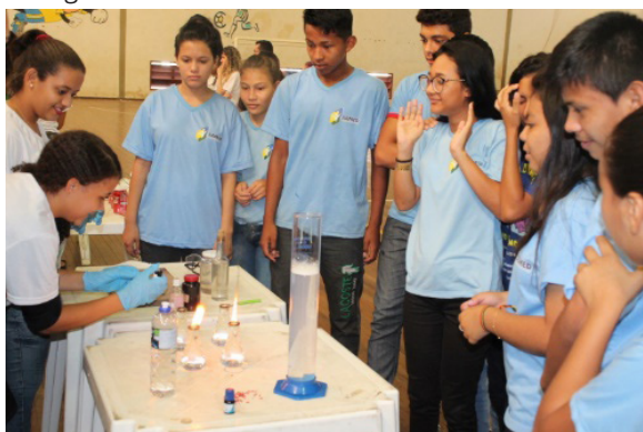
Figura 1: Apresentação na Escola Municipal de Balbina, em agosto de 2018.

O Projeto Entre Iguais foi iniciado em 2016 no IFAM Campus Presidente Figueiredo com o intuito de apresentar conceitos das disciplinas de Ciências, na forma de experimentos práticos para estudantes de escolas localizadas na zona rural e urbana do município de Presidente Figueiredo. O objetivo principal do projeto foi facilitar o processo de ensino-aprendizagem em ciências, utilizando as atividades experimentais como elemento facilitador (Figura 1).