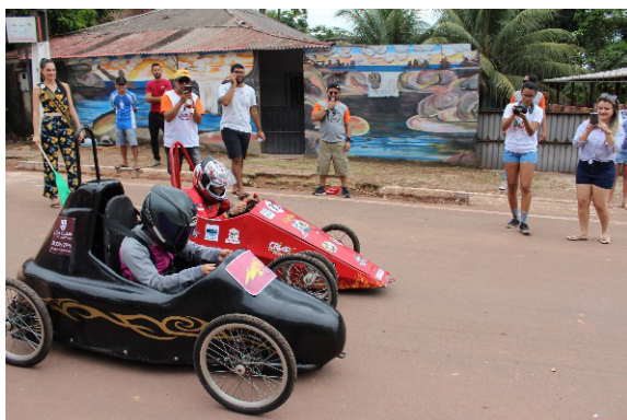
Figura 1: Disputa das equipes.

O Gravity Racing das Cachoeiras ocorre anualmente em Presidente Figueiredo - Am, terra das cachoeiras. É uma competição onde os competidores descem ladeiras em carros que têm a gravidade como única força.