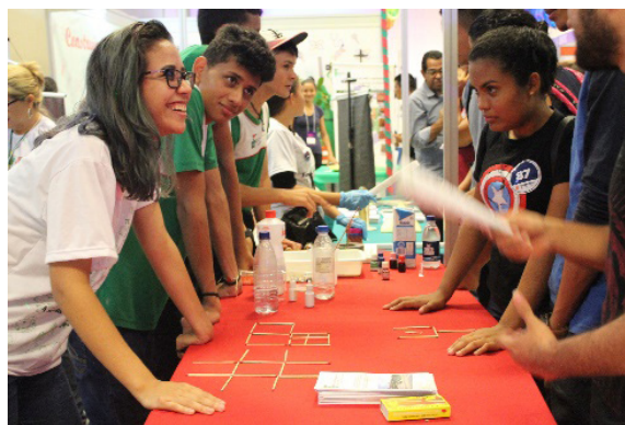
Figura 2: Apresentação na Feira Norte do Estudante, em setembro de 2018.

Foram selecionados alunos do ensino médio integrado do IFAM Campus Presidente Figueiredo para participar do projeto. Os alunos selecionados passaram por um treinamento, visando melhorar sua base conceitual e desenvolver a capacidade de elaboração, montagem e apresentação das atividades práticas a serem apresentadas.