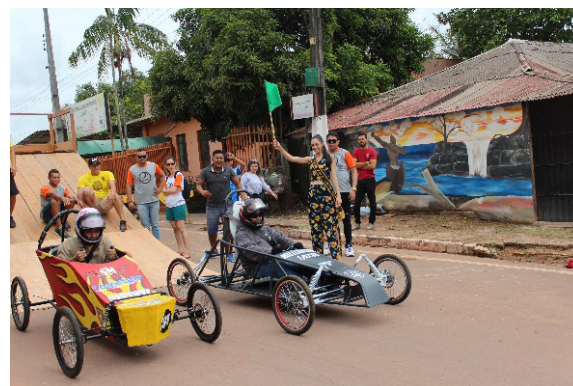
Figura 2: Disputa das equipes.

O evento foi idealizado como agente motivador à dinâmica de ensino-aprendizagem, pois sua aplicação visa relevante impacto cognitivo e intelectual a fim de facilitar a busca por conhecimento e aprendizagem.