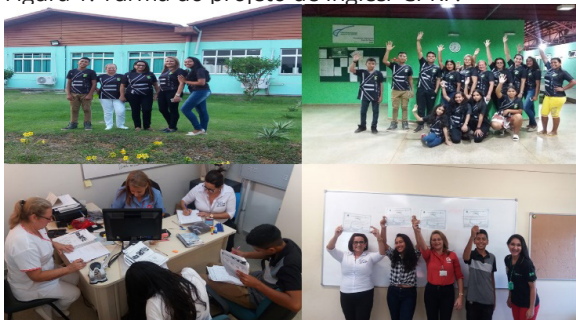
Figura 1: Turma do projeto de Inglês/ CPRF.

Projetos de Extensão nos moldes de cursos livres em línguas com enfoque no inglês e espanhol, já são uma prática comum no Campus de Presidente Figueiredo (CPRF). Excepcionalmente em 2018, foi possível identificar uma necessidade, bem como um interesse particular por parte da equipe de colaboradores terceirizados, a oferta de cursos em outros idiomas que possibilitassem a eles a qualificação profissional. Assim surgiu o projeto: Curso livre de línguas em inglês e espanhol para os terceirizados- CPRF.