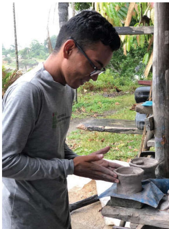
Figura 5. Produção de artefatos de barro, mini fogareiro e panela.