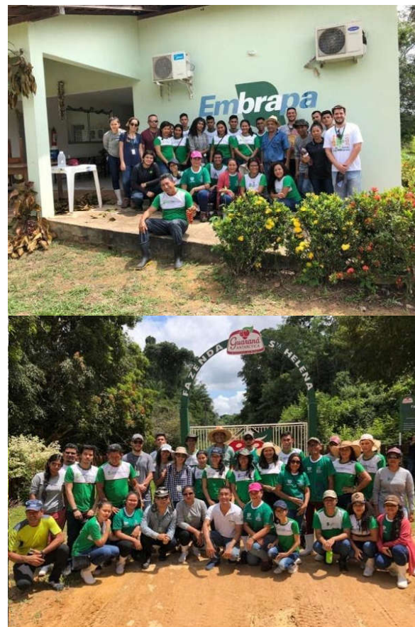
Figura 2. Visitas da equipe EMBRAPA Maués e Fazenda Santa Helena AMBEV

Conforme planejado realizamos as visitas na EMBRAPA e Fazenda Santa Helena, vivenciamos realidades inimagináveis e pudemos entender a importância da produção do guaraná e todas as fases de produção e processamento desta cultura (FIGURA 2).