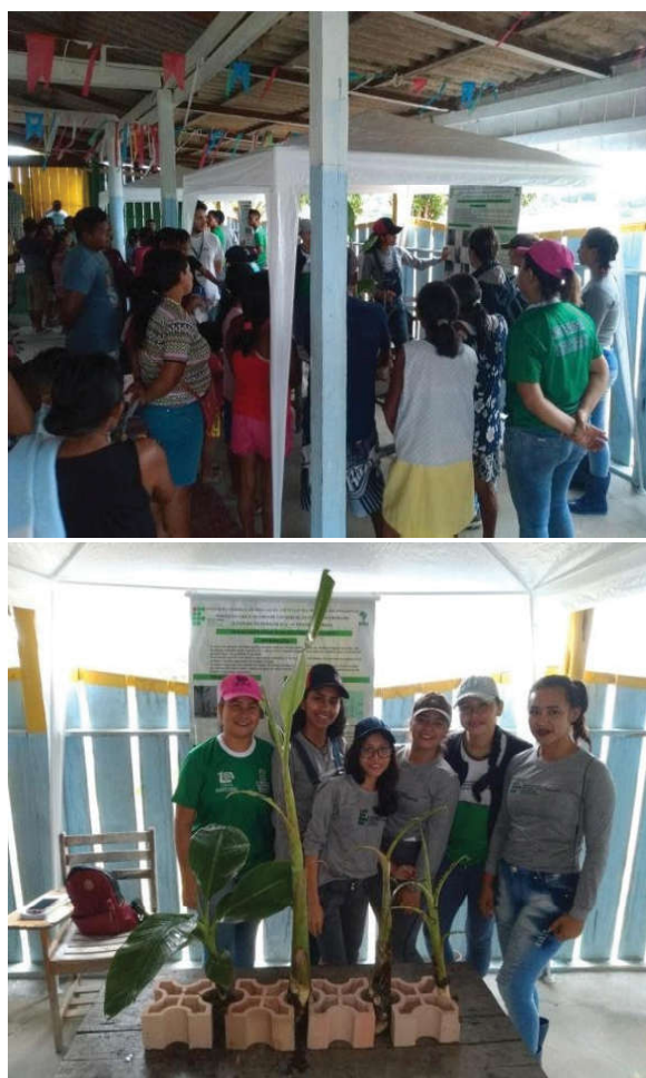
Figura 3. Estandes das mostras realizada pelos alunos

das atividades. Seis tendas foram montadas (Figura 3) e assim as equipes apresentaram seus temas aos participantes. Como eram muitos temas e muita gente, a metodologia utilizada foi a de um “Dia de Campo” onde os produtores passariam pelas estações onde as mostras estavam ocorrendo e em seguida partiriam para a próxima estação e assim por diante. Nesta metodologia utilizamos o tempo de 15 minutos por estação e ao final de todas as apresentações os alunos e servidores ficaram a disposição para esclarecer dúvidas com os produtores.