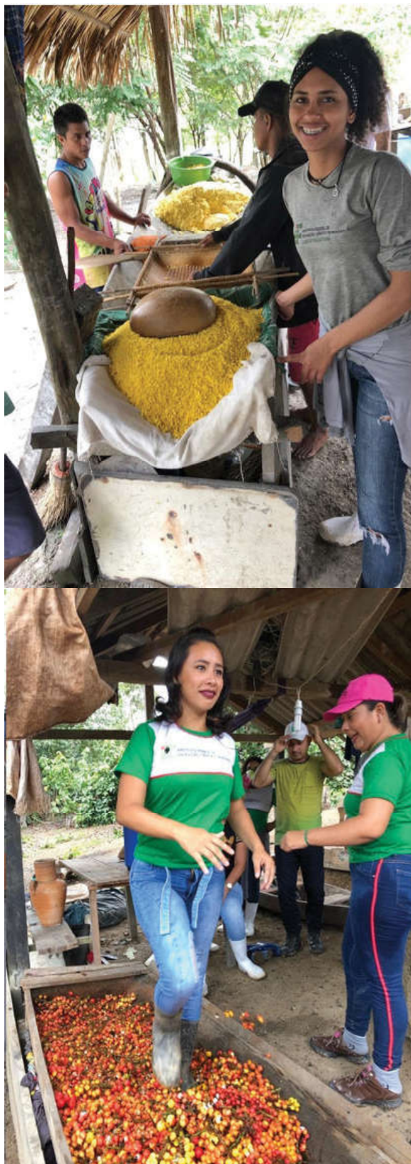
Figura 4. Farinhada e Processamento de Guaraná.