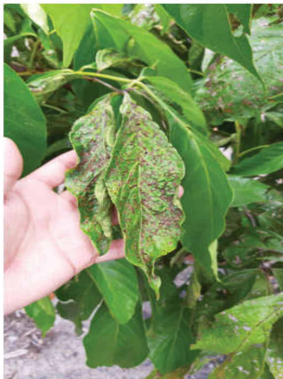
Figura 1. Guaranazeiro com sintomas de antracnose e superbrotamento

Outro problema identificado foi a presença de superbrotamento causado pelo fungo Fusarium decemcellulare (FIGURA 1). Este patógeno infecta os brotos novos, como gemas e inflorescências, causando a multiplicação exagerada de células, tanto em gemas florais quanto em gemas vegetativas, que se tornam áreas de competição com os ramos e folhas saudias, comprometendo o desenvolvimento estrutural da planta, prejudicando assim a sua produtividade (ARAÚJO et al., 2006).