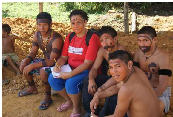
Figura 2: Alunos Yanomami do IFAM.

Durante três dias de festa há muita dança e cantoria com a finalidade de interação dos homens com o mundo espiritual e para que isso aconteça o ritual do paricá acontece. Normalmente o ritual é praticado todos os dias no xapono com participação apenas dos homens iniciados, os hekura. Eles são pouco a pouco introduzidos nesse mundo e, quando nele estão, são capazes de falar com os animais, com os espíritos ancestrais e prever acontecimentos futuros. Para presenciarmos o ritual fomos acompanhados de alunos do IFAM que estavam sendo iniciados nas práticas xamânicas da comunidade.